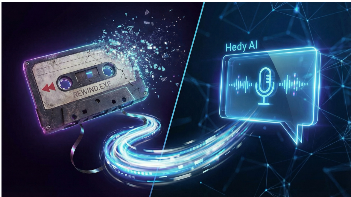
Geteilte Illustration einer zerfallenden Kassette mit der Aufschrift Rewind, die sich in das Hedy AI-Mikrofon-Icon verwandelt

Diesen Artikel online lesen: https://www.hedy.ai/de/post/export-limitless-data-to-hedy/