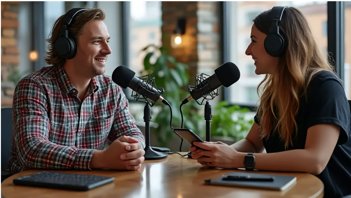
Dos personas con auriculares sonriéndose mutuamente a través de una mesa con micrófonos de podcast

Leer este artículo en línea: https://www.hedy.ai/es/post/audio-and-video-transcription-complete-guide/