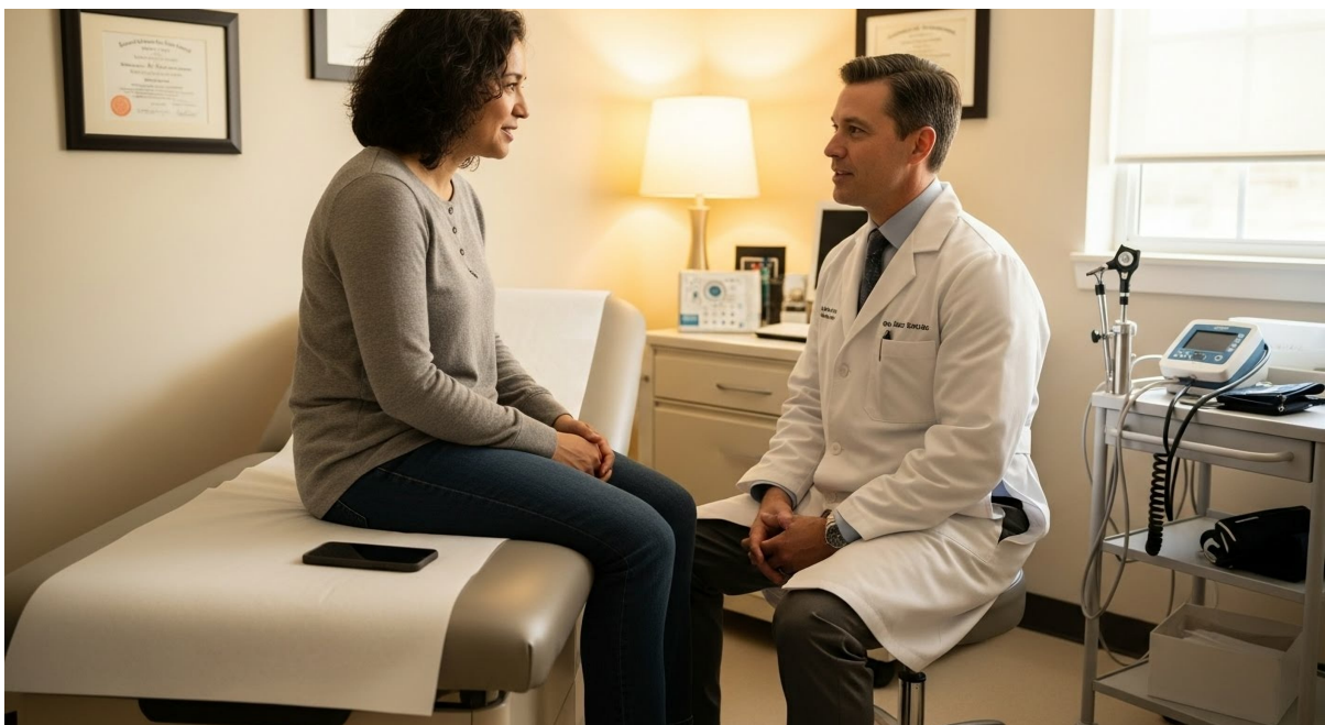
Paciente sentado en una camilla de exploración hablando con un médico con bata blanca en una consulta clínica

Leer este artículo en línea: https://www.hedy.ai/es/post/best-ai-patient-tools/