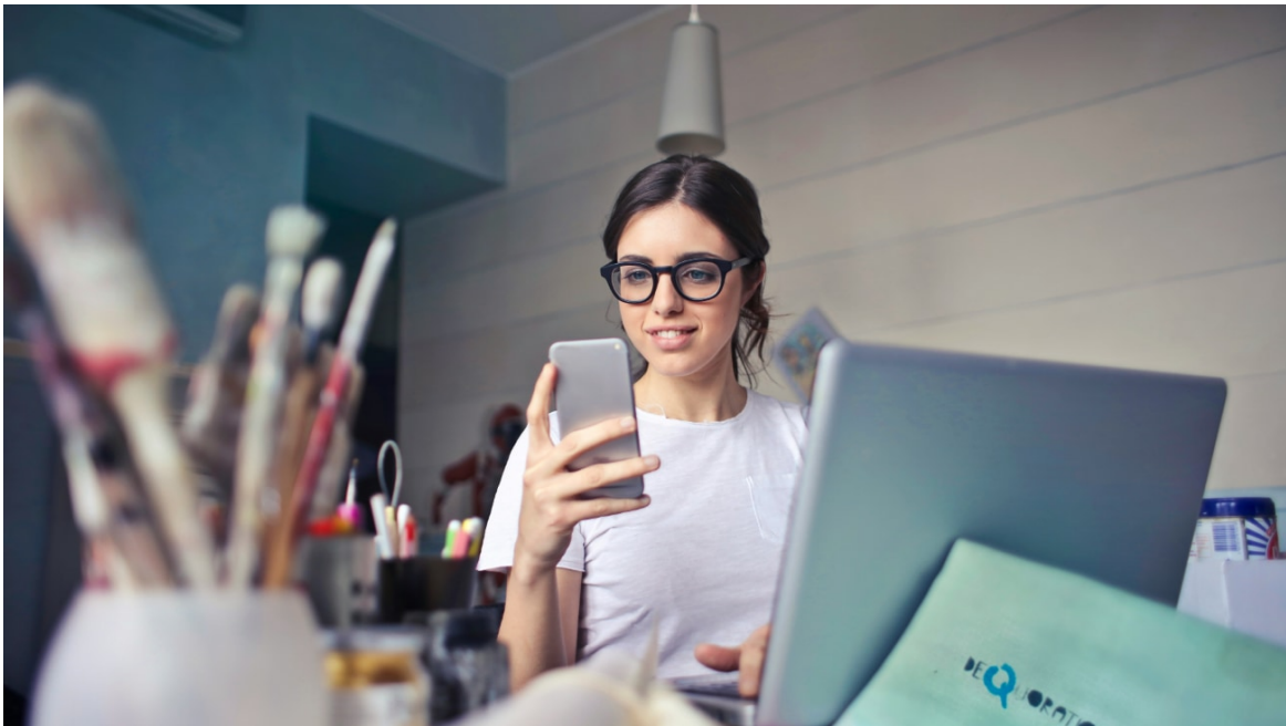
Mujer con gafas revisando su telefono mientras esta sentada en un escritorio con una laptop

Leer este artículo en línea: https://www.hedy.ai/es/post/session-recap-emails-meeting-insights/