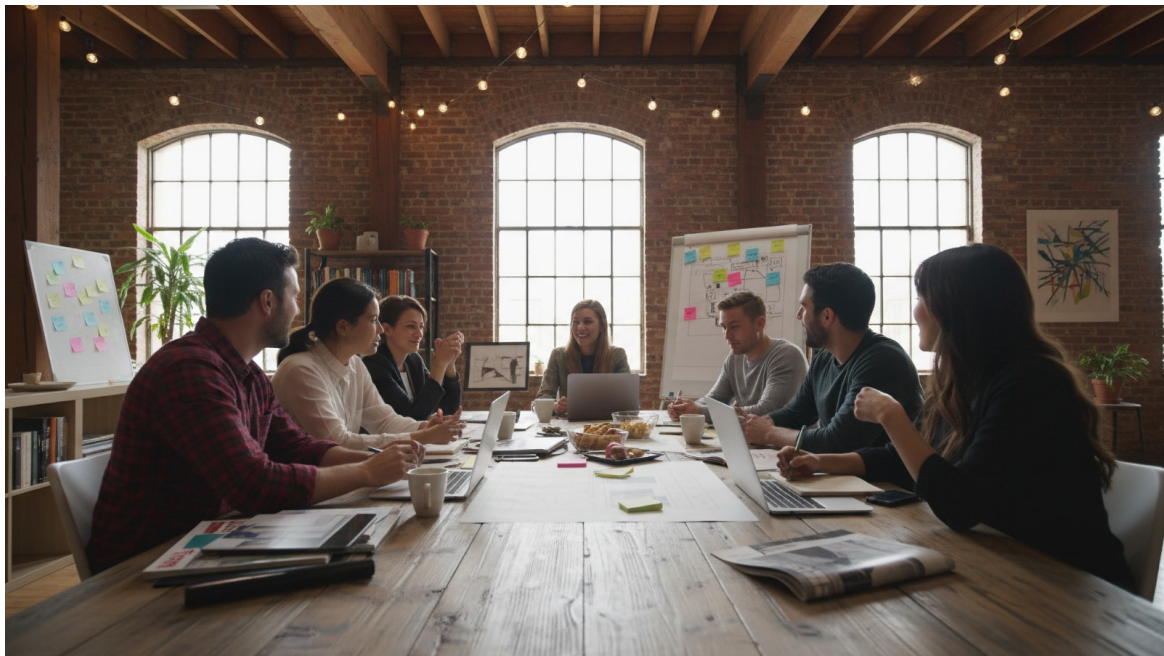
Équipe de sept personnes collaborant autour d'une longue table dans un bureau loft aux murs de briques avec des tableaux blancs

Lire cet article en ligne: https://www.hedy.ai/fr/post/ai-meeting-prep-topic-insights/