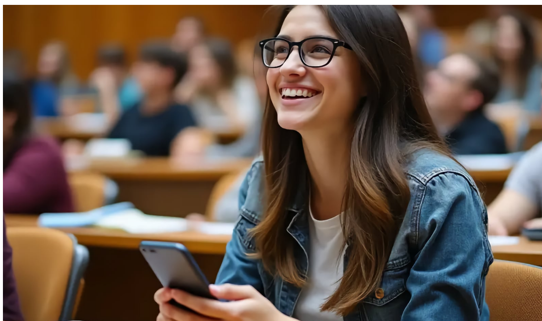
Femme souriante avec des lunettes tenant un smartphone dans le public d'un amphithéâtre

Lire cet article en ligne: https://www.hedy.ai/fr/post/hedy-ai-automatic-suggestions/