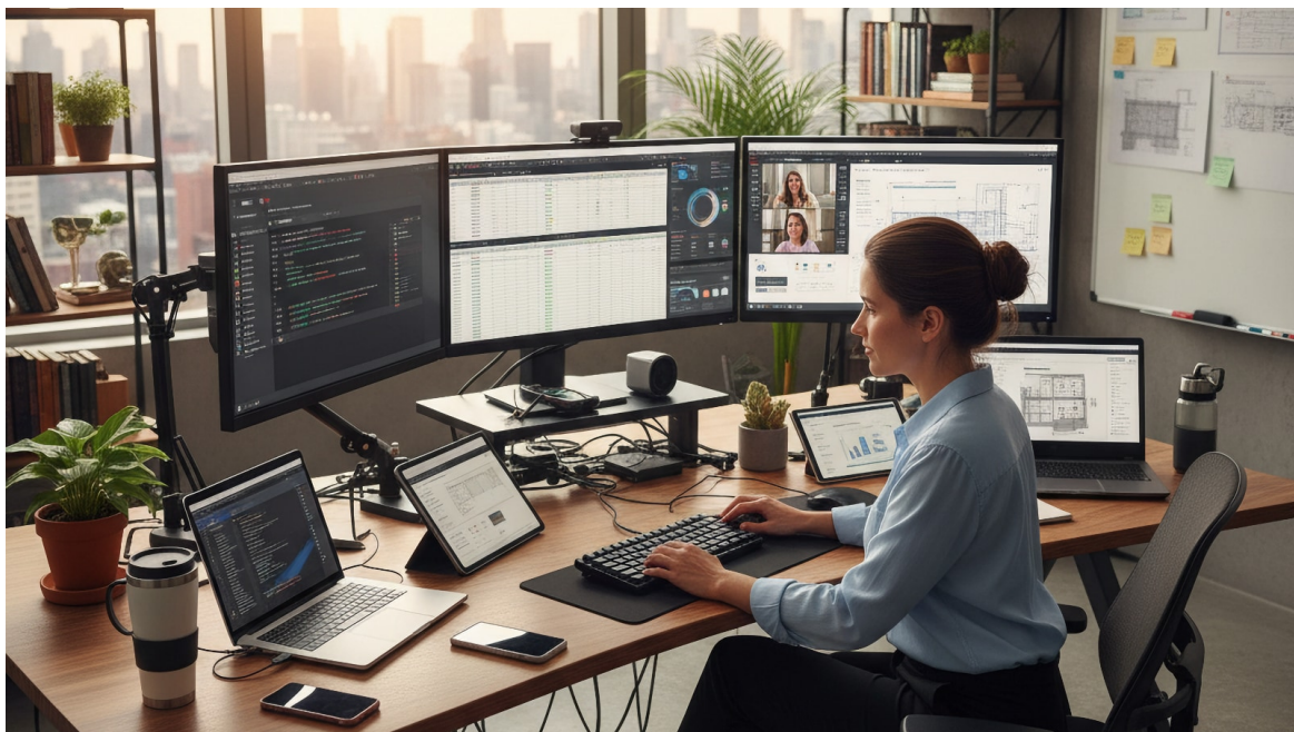
Femme travaillant à un poste de travail multi-écrans avec des tableaux de bord et un appel vidéo

Lire cet article en ligne: https://www.hedy.ai/fr/post/hedy-meeting-assistant-activepieces-integration-automation/