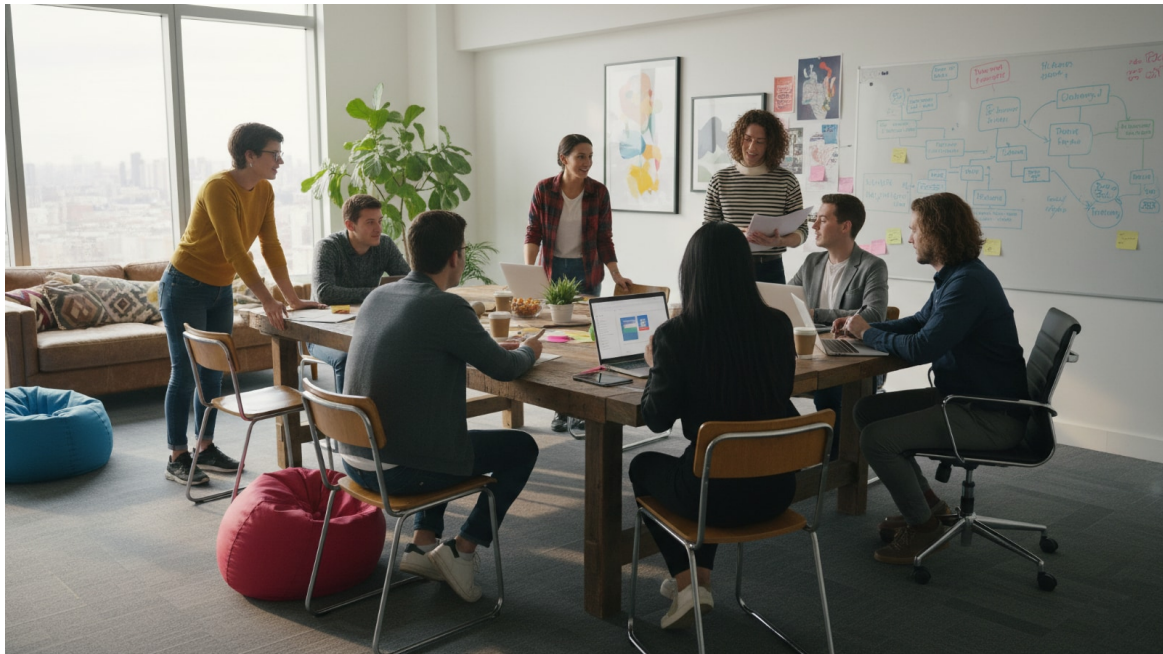
Équipe diversifiée réunie autour d'une table avec des ordinateurs portables dans un bureau moderne et lumineux avec vue sur la ville

Lire cet article en ligne: https://www.hedy.ai/fr/post/koerting-institute-real-time-ai-meeting-intelligence-europe/