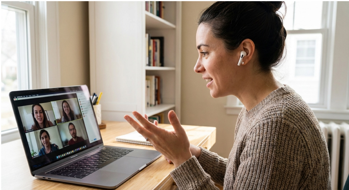
Mulher usando fones de ouvido gesticulando durante uma videochamada com quatro participantes no laptop em casa

Ler este artigo online: https://www.hedy.ai/pt/post/december-2025-updates/