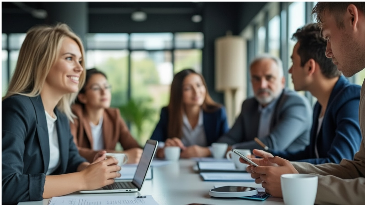
Mulher sorridente liderando uma reunião com cinco colegas ao redor de uma mesa de conferência com laptops

Ler este artigo online: https://www.hedy.ai/pt/post/hedy-2-10-smarter-context-flexible-transcription/